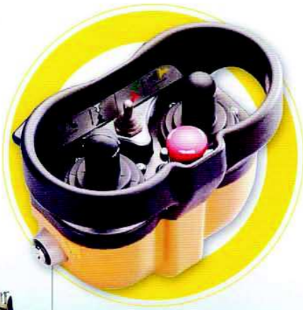
● REMOTE CONTROL RADIO COMMANDE