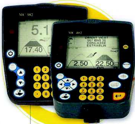
● MC382 / MC402